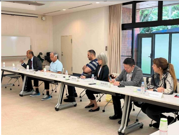
冒頭の産総研紹介に対する質疑応答の様子

7月9日、参加者は、産業技術総合研究所つくばセンターに在する「サイエンス・スクエアつくば」および「地質標本館」を訪問し、炭素繊維、小型半導体製造装置、地下鉱物資源などにかかる研究成果、展示を視察するとともに、専門家との間で質疑応答がなされました。参加者からは、アラブ諸国における、エネルギー生産、人工知能、DX、農業分野における関心の高まりが紹介され、今後の協力に向けた意見交換がなされました。