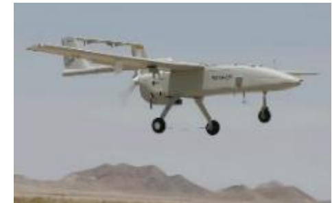
イランが供与したとされるドローン