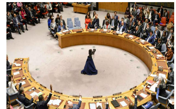
国連安保理決議第2728号の採決の様子(3月25日)