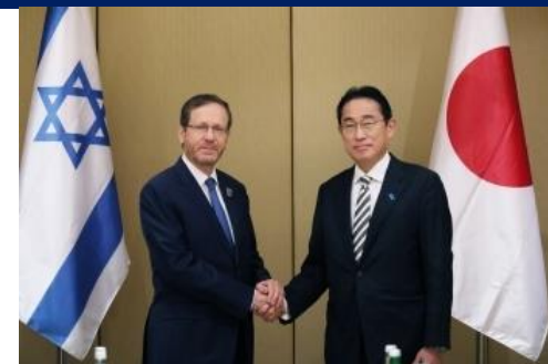
日イスラエル首脳会談 (2023年12月)

(注：CEAPADは、東アジア諸国のリソースや経済発展の知見を活かしてパレスチナの国づくりを支援すべく、2013年に日本が立ち上げた地域協議枠組)