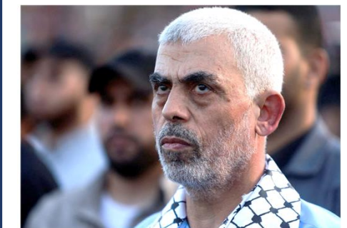
シンワル・ハマスの新政治局長 14