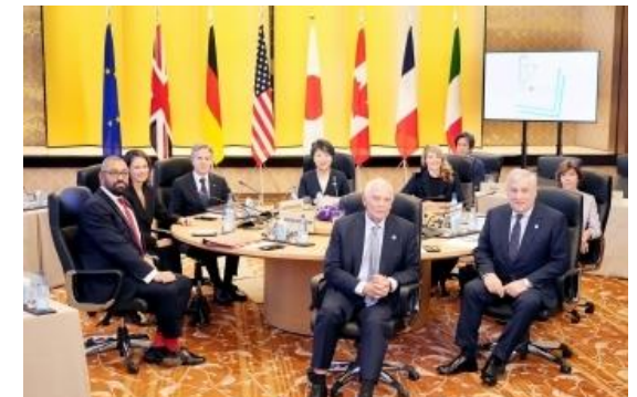
G7外相会合 (昨年11月7・8日、於：東京)