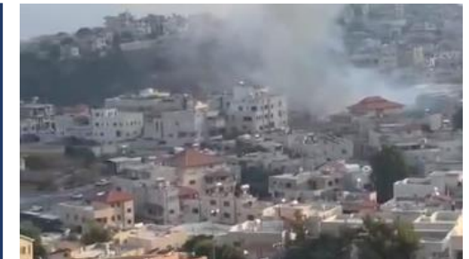
攻撃を受けたゴラン高原のマジダル・シャムス村