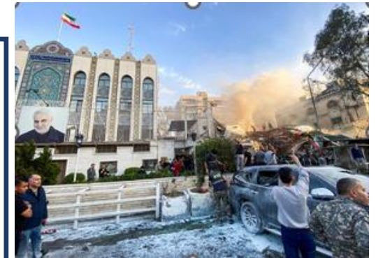
ミサイル攻撃を受けたとされるイラン大使館関連施設