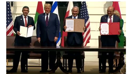
ホワイトハウスにおける署名式 (2020年9月)