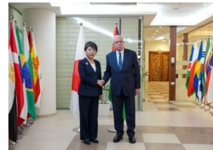
日パレスチナ外相会談 (2023年11月)