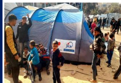
ガザ地区に到着したテント