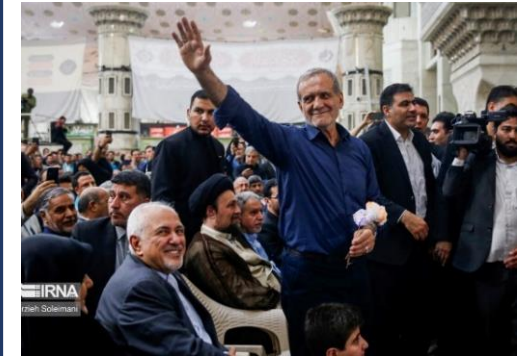
勝利後の集会で声援に答えるペゼシュキアン次期大統領。手前はザリーフ元外相。