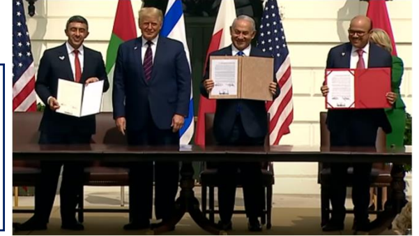
ホワイトハウスにおける署名式 (2020年9月)