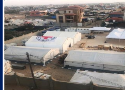
日本の支援により、国際赤十字委員会 (ICRC) がガザ (ラファハ) に開設した野外病院10