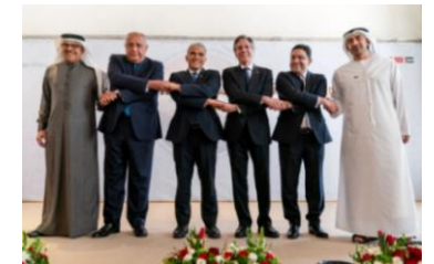
左から、バーレーン、エジプト イスラエル、米、モロッコ、UAE外相