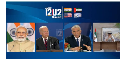
I2U2 首脳オンライン会合 5