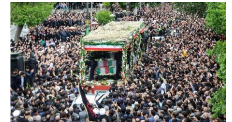
ライースィー前大統領の葬儀当日の現地の様子