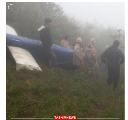
ヘリコプターの墜落現場とされる写真