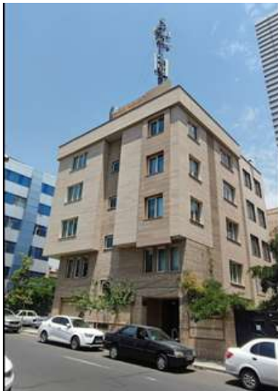
オフィス概観（当ビルの4F） Office Photo（4th Floor）