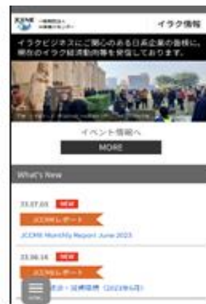
図：リニューアル後のPC版表示（左）とモバイル端末版表示（右）

各ページの内容を見直し、定期および不定期の情報更新を行うことでイラク経済動向に関する発信を強化してまいります。「JCCME レポート」のページには、弊財団イラク代表事務所が現地報道などをまとめた月報に代表される弊財団発行資料を、「ビジネス関連資料」